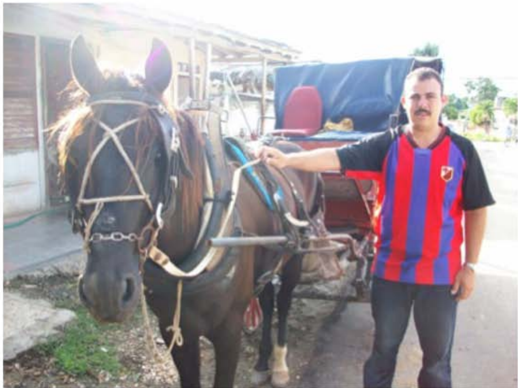
Este pastor puede usar el caballo y la carreta para alcanzar más gente con su ministerio y también para trabajar en su finca y suplir para su familia.

En las comunidades de las montañas de Laos y Vietnam, las motocicletas sirven con