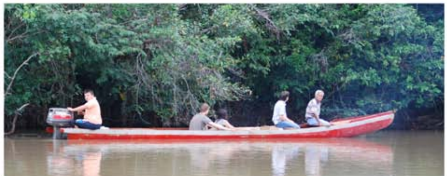
Trabajadores VOM usan métodos creativos para distribuir Biblias en áreas de Colombia controladas por los guerrilleros donde no hay calles.

Aunque el mismo Tyndale fue capturado y ejecutado, se esparcieron muchas Biblias alrededor del país después de su muerte hasta que el Rey Santiago comisionó su propia versión de la Biblia.