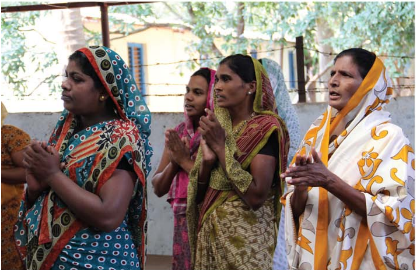
VOM recientemente unió a ocho mujeres quienes perdieron sus esposos en la violencia Orissa del 2008. Ellas se reunieron para un tiempo de comunión, oración, y consejería.