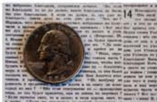
Nuevos Testamentos Rusos fueron impresos en letra muy pequeña en los años 1970 para mantener pequeños los libros.

Hoy nos continuamos adaptando a situaciones difíciles. Si los creyentes en naciones cautivas pueden valientemente compartir la Palabra de Dios, nosotros también podemos encontrar nuevas formas para imprimir la Palabra y entregárselas. Seguimos lanzando globos anaranjados de polietileno en Corea de Norte con