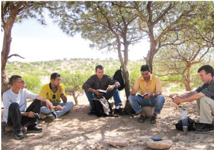
Creyentes Kabyle en Algeria se reúnen a veces para un Estudio Bíblico al aire libre para evitar vigilancia de policías. Con la nueva traducción Kabyle, pueden estudiar la Biblia en su propio idioma.