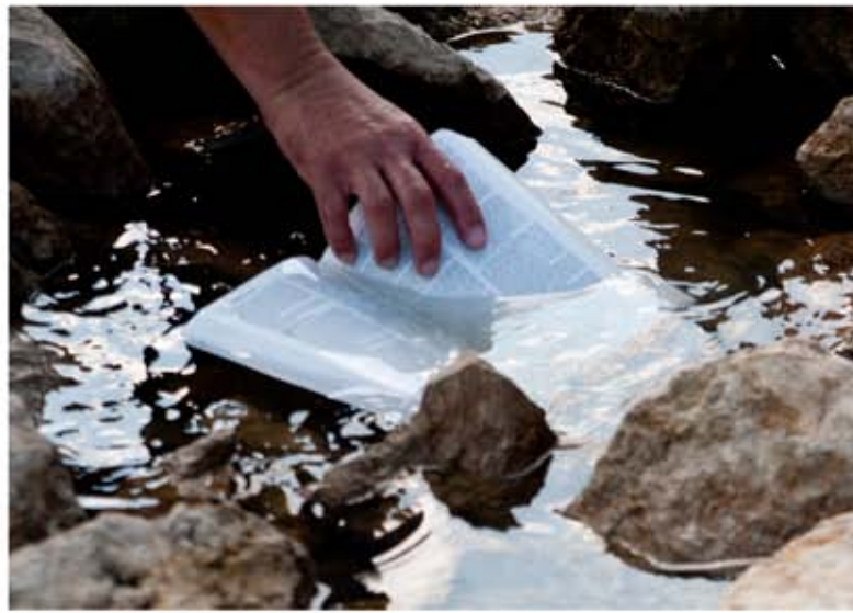
Biblias impermeables ahora son repartidas por medio de botes, mulas, y motocicletas en Colombia. Las páginas plásticas ayudarán a preservarlas aun en las condiciones ásperas de la jungla.

Ermitaño" ya que su gobierno intenta aislar a su gente del resto del mundo.