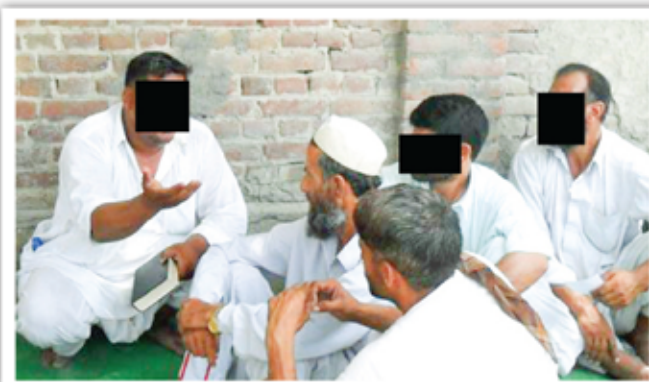
Este evangelista, a quien VOM apoya en el Medio Oriente, regresó a ministrar a una región donde fue secuestrado y torturado hace varios años. Menos de 1 por ciento de la población allí es cristiana.

El presentar a la persecución de los cristianos como algo "malo" o "injusto" es una teología a medio cocinar. Jesús dijo que